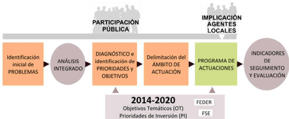
Figura 1. Diagrama orientativo de desarrollo de la estrategia integrada.

En este contexto, conviene subrayar aquellos principios que orientan el referido artículo 7 del Reglamento FEDER y que deberían guiar la elaboración de las estrategias integradas de desarrollo urbano sostenible: