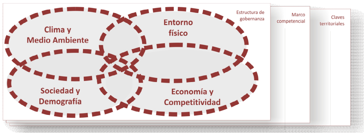
Figura 2. Principales ámbitos del análisis integrado.

El objeto de este análisis es conocer en profundidad las principales debilidades y amenazas que afectan al entorno urbano así como sus fortalezas, y los principales factores y claves territoriales de su desarrollo para abordar los múltiples retos a los que se enfrentan las áreas urbanas, transformando éstos en oportunidades.